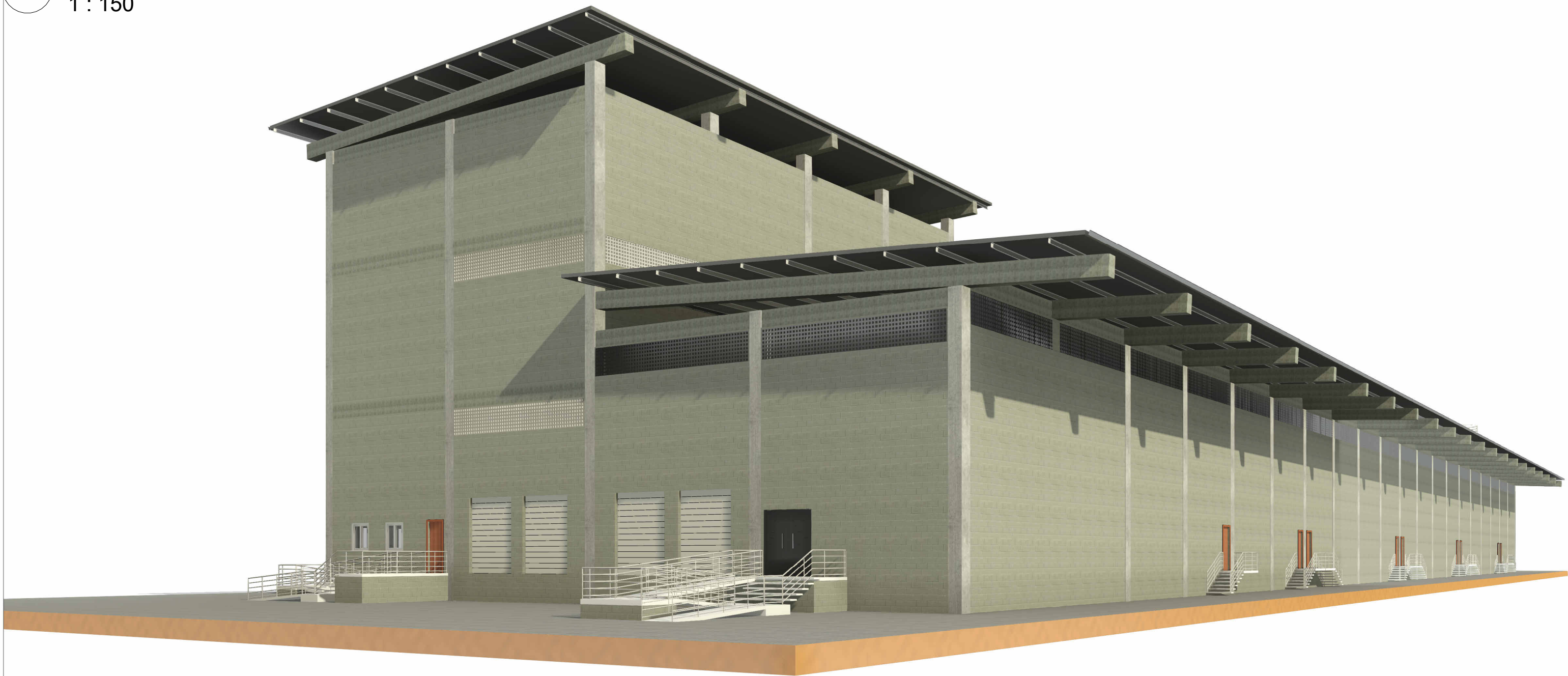
5 PERSPECTIVA 1