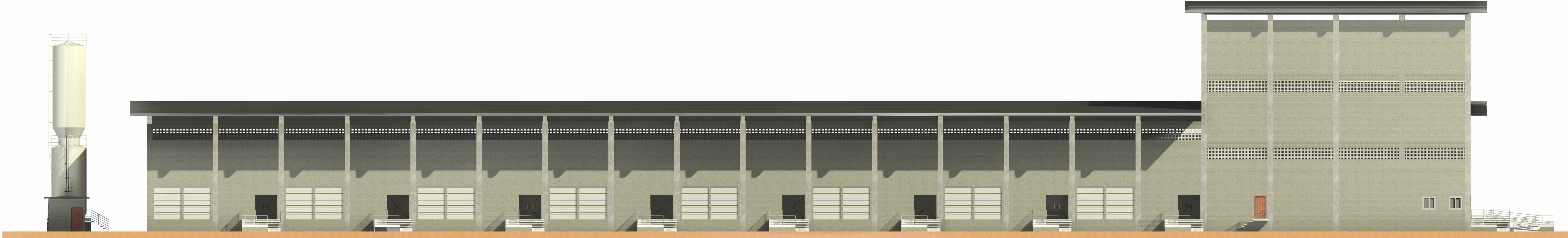
3 FACHADA NORTE 1 : 150