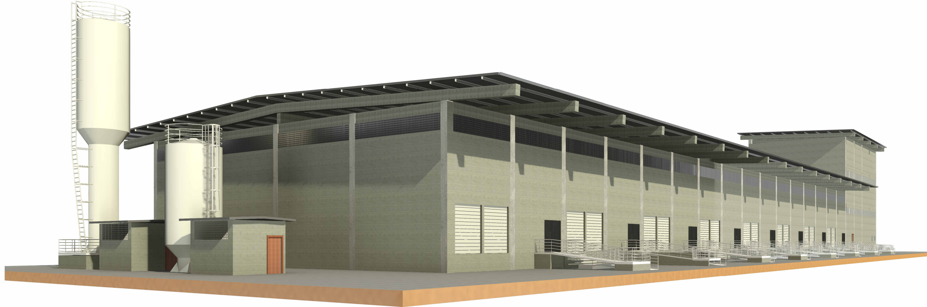
6 PERSPECTIVA 2