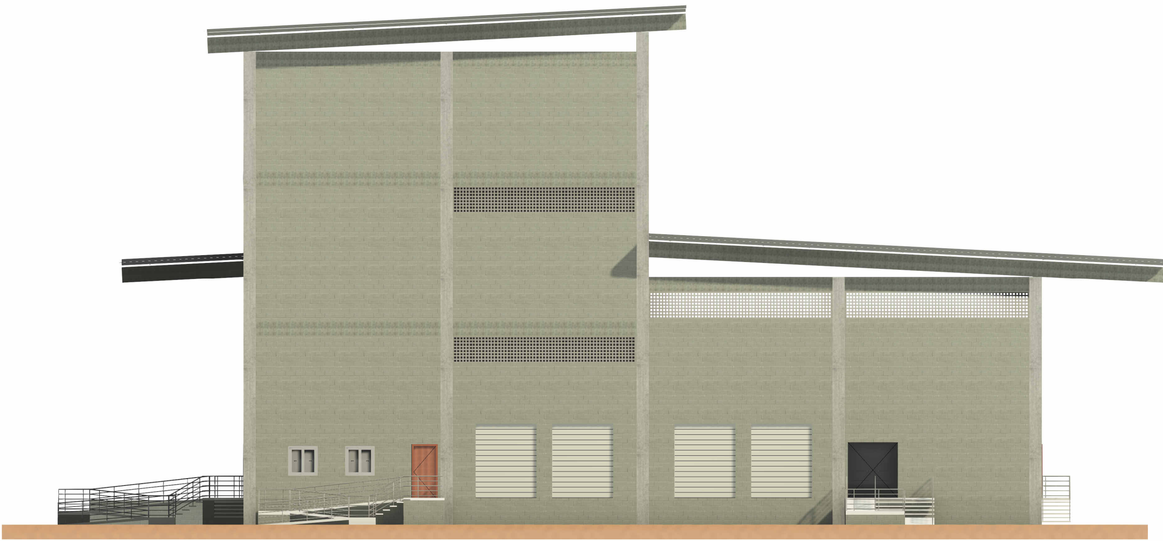
2 FACHADA OESTE 1 : 150